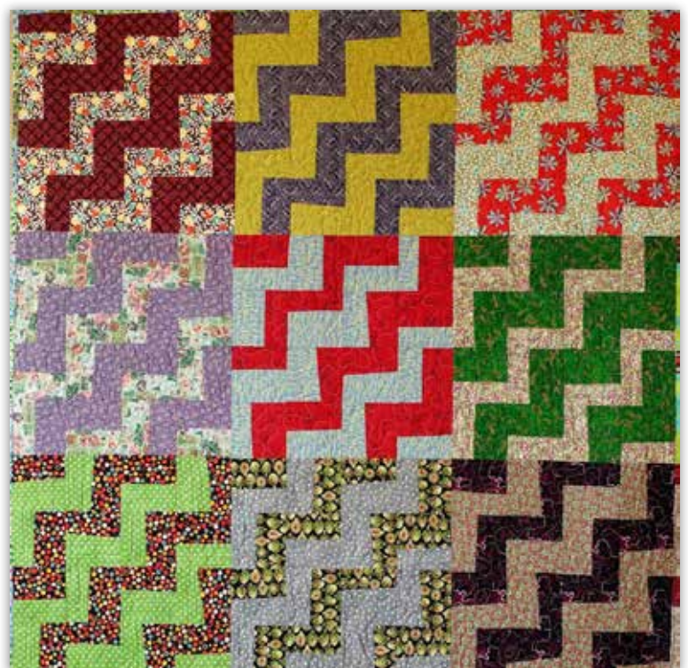
"Rail Fence", inspireret af den klassiske blok og andre flettede genstande, fx. en taske. Bemærk brugen af småmønstrede stoffer. 2013. Mål ca. 205 x 245 cm. Blokstørrelse ca. 40,5 cm.