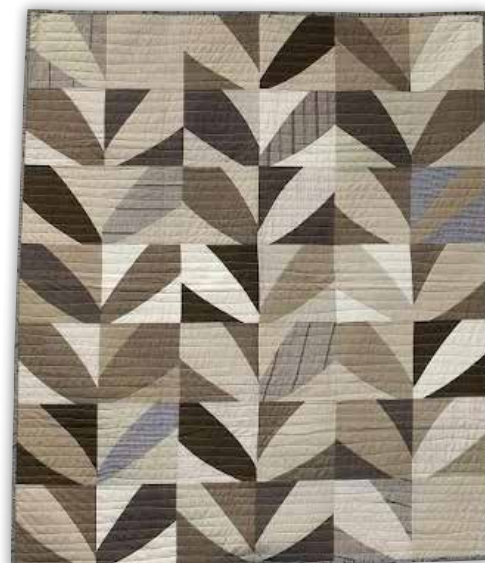
Quilt fra bogen "Cultural Fusion Quilts".