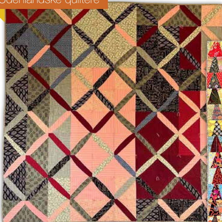
"Lattice" (gitter). Inspireret af håndskårne vinduer fra et gammelt fort. 2013. Mål ca. 153 x 153 cm. Blokstørrelse ca. 15 x 15 cm.