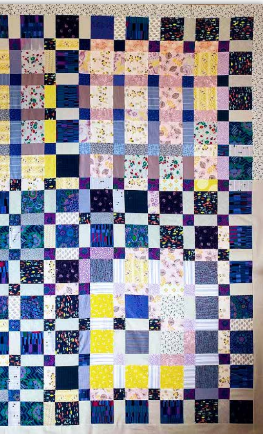
Quilt syet i blå og gule farver. Inspireret af en Gee's Bend Quilt. 2019. Mål ca. 183 x 198 cm.

til at sy på et arbejde. Det er vigtigere end perfektion. Inspiration kan komme mange steder fra: Gåture i skoven, ved kysten, fra rejser eller nogle stoffer, der ligger på ens bord. Nogle gange giver de nye ideer.