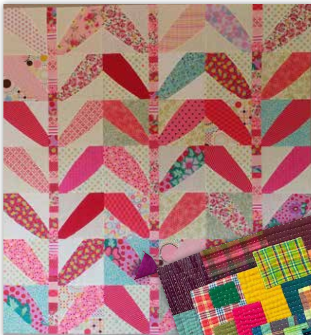
Babyquilt. Kilemønster som i quilten "Lattice". Syet i røde, blå og turkise farver. 2021.

- ved at lytte til din indre stemme og gøre tingene på din egen måde.