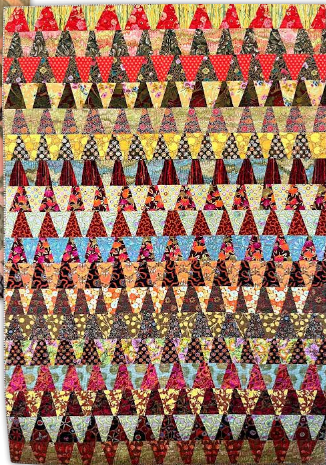
"Endless Mountains" (uendelige bjerge). Inspireret af folkekunst fra Indien. 2013. Mål ca. 152 x 229 cm.