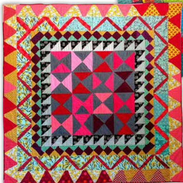
"Postkort fra Thailand". Rød medaljon quilt. 2021. Mål ca. 142 x 142 cm.