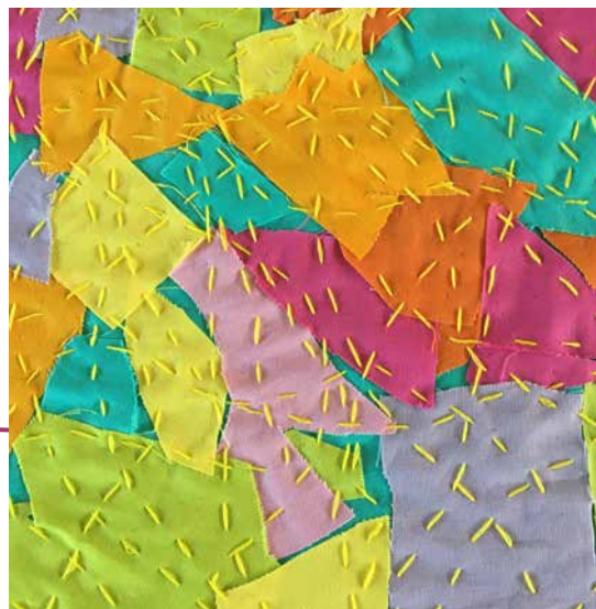
En dreng fra 7. klasse skabte en collage og syede med frie sting i gult over hele fladen efterfølgende.