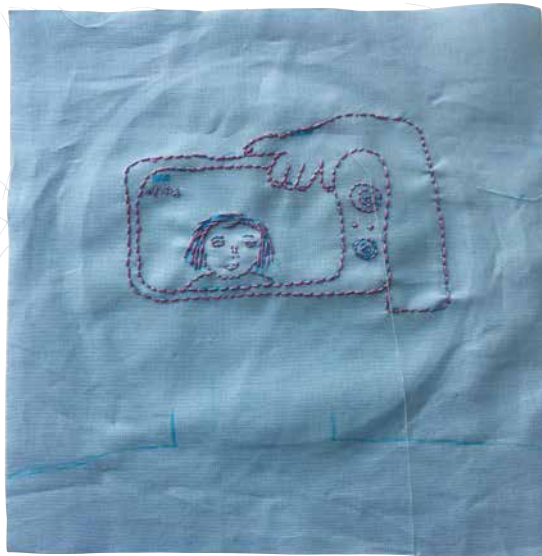
En pige i 7. klasse broderede en selfie til skolens vægtæppe. Her ses broderiet, inden den vandopløselige tusch er vasket ud, og broderiet er opspændt.

Jeg er sikker på, at når roen indfinder sig efterfølgende, kommer også eftertænkerne om, hvad det egentlig er, jeg har oplevet i dette år, og hvor mange nye mennesker jeg har mødt. Jeg tænker umiddelbart, at 250-350 i alt har deltaget på de tre projekter. Nogle har bidraget til alle tre projekter, og andre til et af tekstilerne. Men alle bidrag gør dem til det, de er nu. Vi har løftet i flok.