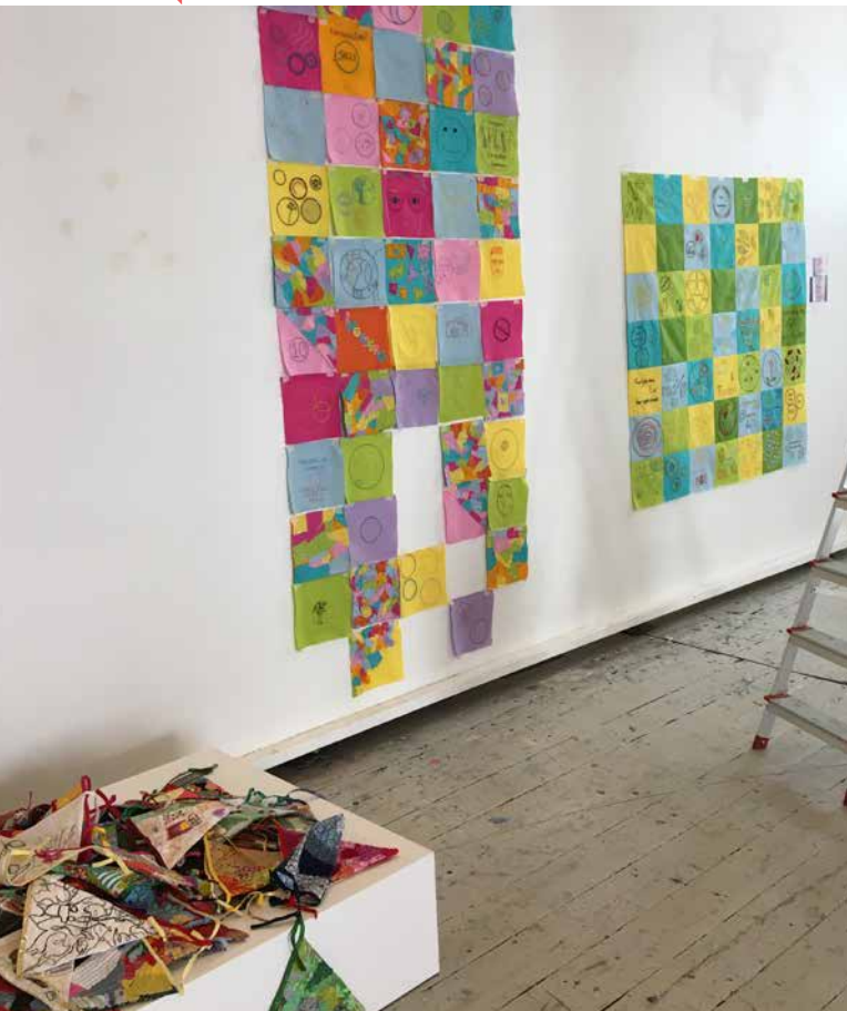
Fotoet er taget på Statens Værksted for Kunst. Alle kvadraterne til kirkens tæppe til højre er placeret, og næsten alle kvadraterne til skolens tæppe til venstre er på plads. Nederst i billedet alle vimplerne.