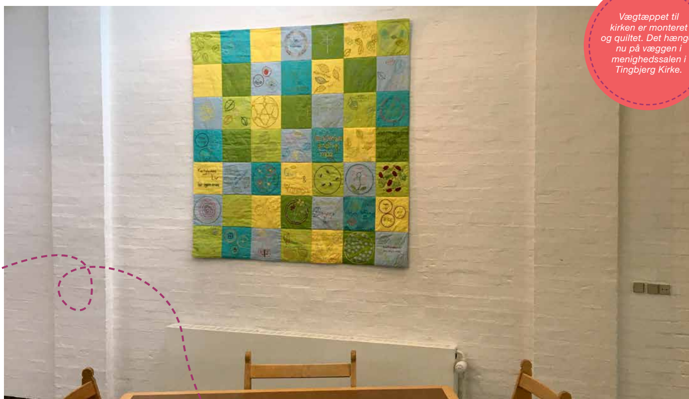
Vægtæppet til kirken er monteret og quiltet. Det hænger nu på væggen i menighedssalen i Tingbjerg Kirke.

For mig var det fint at have så stort et atelier, da begge vægtæpper kunne hænge samtidigt på væggene, og jeg kunne vurdere, hvordan alle kvadraterne skulle fordeles bedst muligt. Desuden var der kæmpestore borde i arbejdshøjde, hvor også vægtæppet til skolen, som er næsten