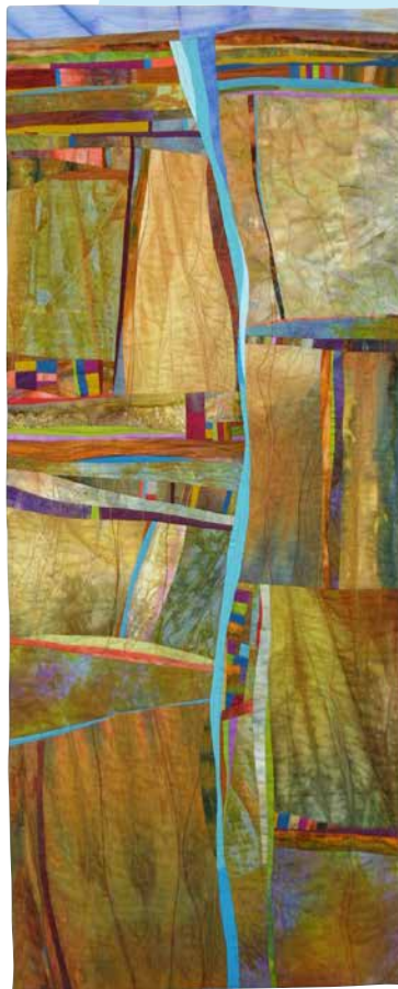
Beneath the Earth. Her har Jean forsøgt at forestille sig, hvordan det ser ud under hendes fødder. De smalle strimler og de små stofstykker er hendes signaturteknik. Quilten måler 18" x 45" (ca. 46 x 115 cm).

Brandkorpset og flere andre hjælpere er i gang med at hænge quilte op til Sisters Outdoor Quilt Show. Quiltene her er syet af personalet fra butikken The Stitchin' Post. Se flere fotos på Facebook.