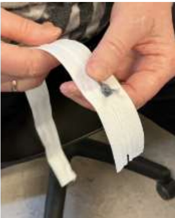
Foto 14e: Lykkedes det? Ellers prøv igen og få evt. en anden person til at hjælpe dig.