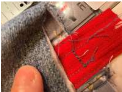
Foto 15: Skub glideren ind midt på penalhuset. Nu skal du sy ved enderne, så lynlåsen ikke glider op. Du skubber det øverste lag lidt til side, så du kan komme til. Sy for begge ender.