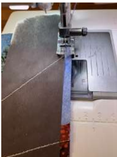
Foto 2: Læg dit bonrullestof ret mod ret langs kanten af det andet stof og sy langs bonrullen.

Foto 1: Jeg har brugt en stofstrimmel fra bonrullesyningen samt stumper fra et par aflagte cowboybukser, men du kan selvfølgelig også bruge almindeligt stof.