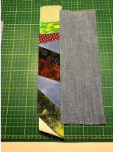
Foto 3: Fold ud og pres. Sy bonrullestoffet på det andet stykke stof på samme måde.