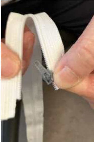
Foto 14a: Tag glideren og sæt den på båndet med tænder. Skub den en lille smule op. Lad som om det er din vinterfrakke, du skal til at tage på. Hold båndet med glider i din venstre hånd.