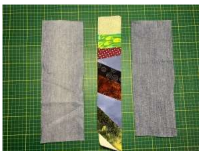
Foto 1: Jeg har brugt en stofstrimmel fra bonrullesyningen samt stumper fra et par aflagte cowboybukser, men du kan selvfølgelig også bruge almindeligt stof.