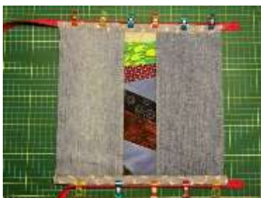
Foto 11: Tag nu din lynlås i metermål og skil den ad. Læg lynlåsens retside mod indersiden af din sandwich i begge side – se fotoet. Husk, den skal gå nogle cm ud over kanten på penalhuset. Sæt den fast med nåle, wondertape eller wonderclips.