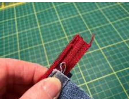
Foto 14: Nu skal du sætte glideren på lynlåsen. Fold penalhuset, så lynlåsbåndene ligger mod hinanden, og penalhusets kanter flugter. Hvis enderne af lynlåsbåndene ikke er lige lange klippes de til, så de er lige lange. Så klipper du ca. 1 cm af tænderne i den ene side. Nu kommer det svære og du kan se detaljerede fotos på næste side.