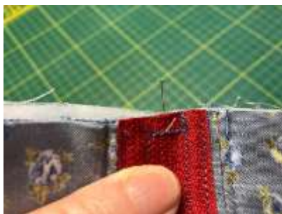
Foto 16: Klip den overskydende lynlås af. Vend nu forsigtigt penalhuset med indersiden ud. Derefter skal du finde midten af stoffet over for lynlåsen og sætte en nål i.