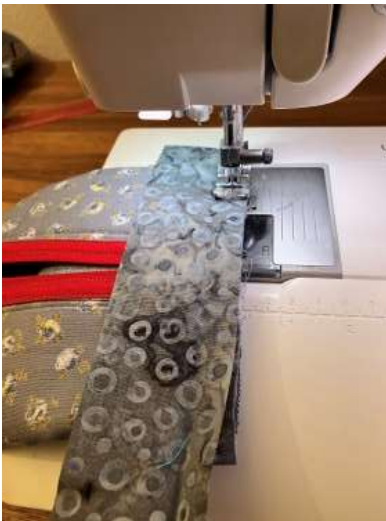
Foto 18: Nu skal du sy lukkekanter på enderne. Det gør du på samme måde som tidligere beskrevet ved de første lukkekanter.