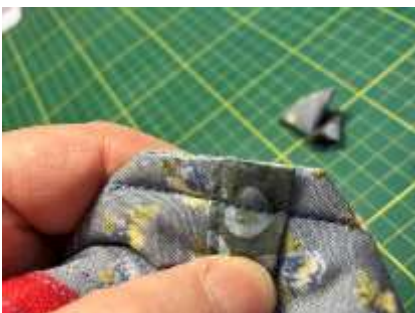
Foto 20: Sy i stregen og klip snippen af, så der er ca. 1 cm sømrum. Zig-zag over trevlekanten.

Vend retten ud og fyld blyanter i penalhuset.