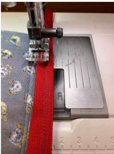
Foto 13: Vend penalhuset om og sy lynlåsbåndet fast fra indersiden af penalhuset.