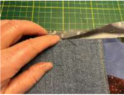
Foto 7, 8 og 9: Så folder du strimlen to gange rundt om sandwichen og syr den fast på retsiden. Gør det samme med den anden ende.