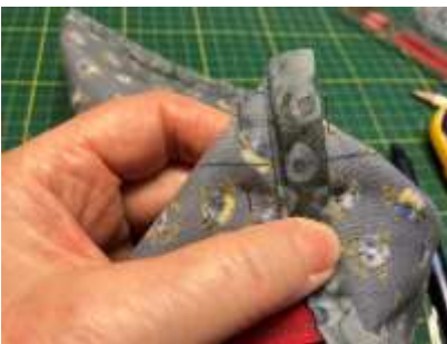
Foto 19: Så mangler du bare penalhusets hjørner. Fold hjørnet som vist på billedet. Sæt nåle i og tegn en streg på ca 5 cm. Den skal ligge ca 2½ cm fra spidsen.