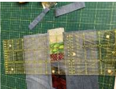
Foto 5: Lav en sandwich af for, mellemlæg og yderstof til penalhuset. Jeg har quiltet langs bonrullestrimlen med en kontrasttråd og 4 mm stinglængde, men du quilter, som du synes. Herefter skæres rent langs alle fire sider.