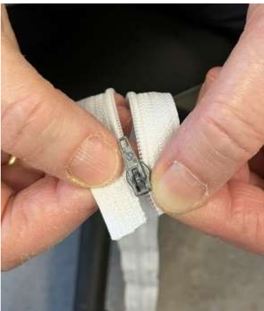
Foto 14b: Med højre hånd skubber du båndet uden tænder op i glideren.

Foto 14a: Tag glideren og sæt den på båndet med tænder. Skub den en lille smule op. Lad som om det er din vinterfrakke, du skal til at tage på. Hold båndet med glider i din venstre hånd.