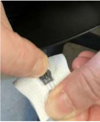
Foto 14d: Træk glideren på plads med højre hånd.