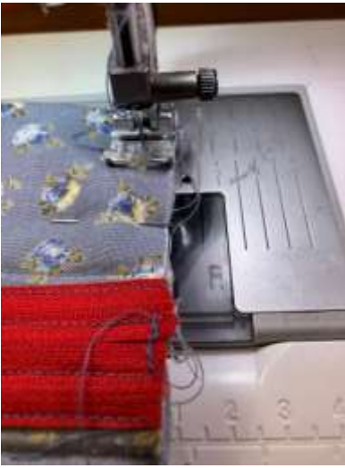
Foto 17: Fold penalhuset, så nålen ligger lige ud for lynlåsens tænder, og sæt et par nåle i. Sørg for, at lynlåsen står lidt åben. Sy nu for enden af penalhuset en sømfodsbredde fra kanten. Sy den anden ende på samme måde.