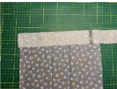
Foto 6: Så skal der sættes lukkekanter på enderne. Her bruger du de 5 cm brede strimler. Skær dem af, så de har samme længde som bredden af dit stof – altså vinkelret på bonrullestrimlen. Du lægger strimlen ret mod ret på foret og syr den fast en trykfodsbredde fra kanten.